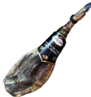
LEGADO IBERICO DE CEBO GRAN RESERVA