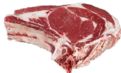
CHULETON ALTO DE VACA