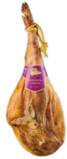
QUESADA CARPIO JAMON DUROC