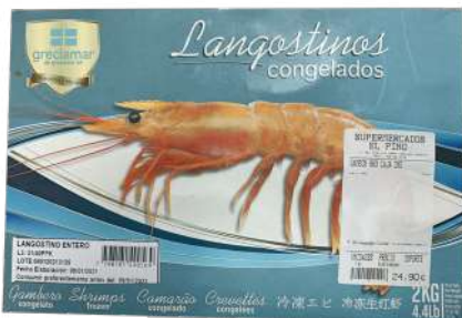
"GAMBON" Numero 3 LANGOSTINOS