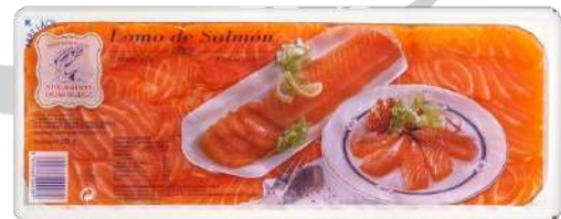
SALMON SOBRE 250g