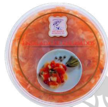
ENSALADA AHUMADOS TARRINA 500g