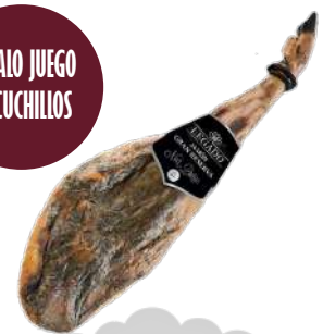
LEGADO NOIR DUROC GRAN RESERVA