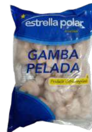
GAMBA PELADA 30/50 ESTRELLA POLAR 650g