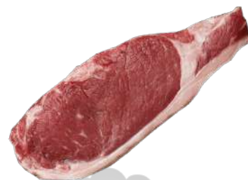
LOMO TERNERA ENTRECOT