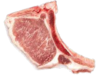
CHULETA CHATO MURCIANO