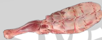
PIERNA DE CORDERO RELLENA