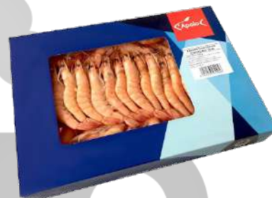
LANGOSTINO COCIDO 40/60 ESTUCHE 750g