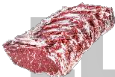
LOMO BAJO DE VACA