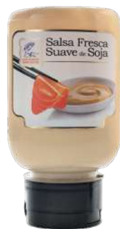
SALSAS PARA SALMON AHUMADO SALSA NORDICA FRESCA Y SALSA FRESCA DE SOJA