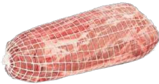
ROTTI DE CERDO