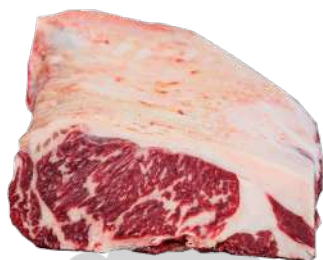
LOMO BAJO DE ANGUS