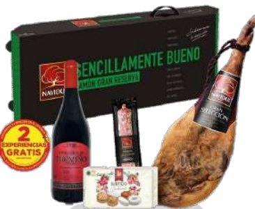
LOTE NAVIDUL GRAN RESERVA