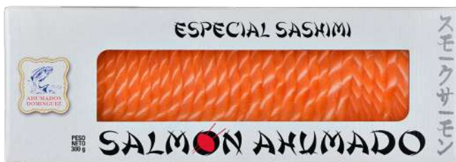
SASHIMI DE SALMON SOBRE 300g

Deleita tu paladar y el de toda tu familia con este exquisito surtido de ahumados. Encuentra tus productos en la sección de charcutería.