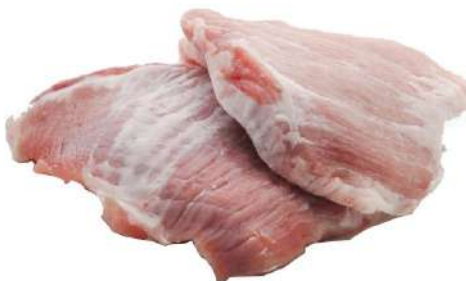
SECRETO CERDO DUROC ALIMENTADO CON CASTAÑAS