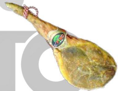
EL PINO JAMON SERRANO PIEZAS ENTRE 6,5 KG Y 7,5 KG