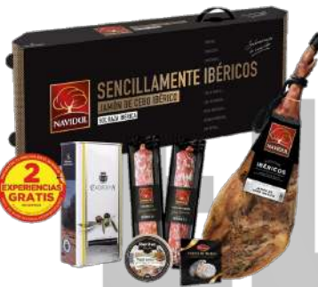
LOTE NAVIDUL ORO JAMON IBERICO DE CEBO