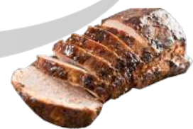
LOMO DE CERDO MECHADO