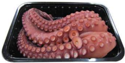
PULPO CONGELADO ENTRE 4 kg - 5 kg