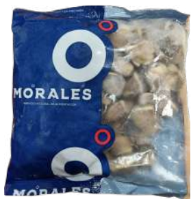
MORALES ALMEJA MARRON DEL PACIFICO