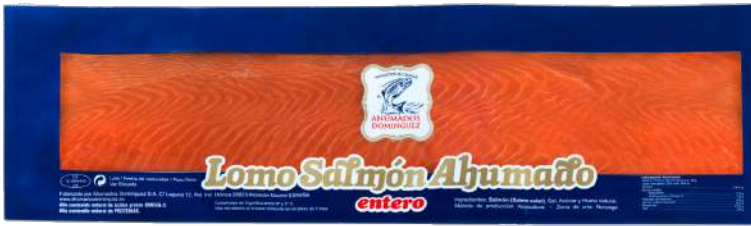
LOMO DE SALMON ENTERO