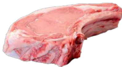
CHULETON TERNERA LECHAL