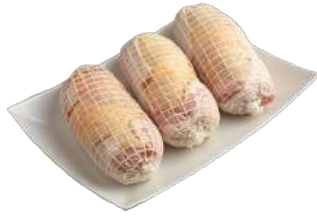
MUSLOS DE POLLO RELLENOS