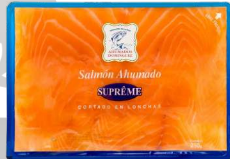
LOMO SALMON SUPREME SOBRE 300g