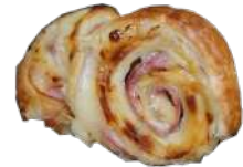
DELICIAS DE TERNERA CON HOJALDRE