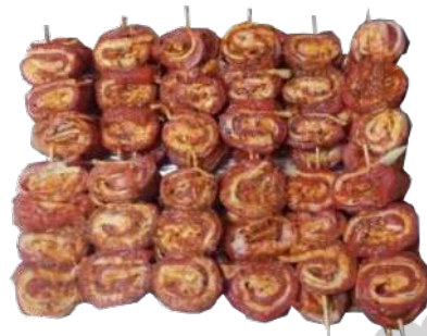
PIRULETAS DE TERNERA