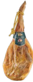
QUESADA CARPIO ALIMENTADO CON CASTAÑAS