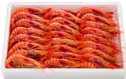
GAMBA ROJA ALISTADA NUMERO 3