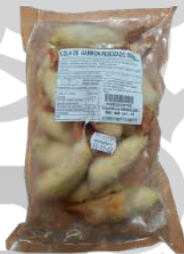
COLAS DE GAMBON REBOZADO BOLSA 500g