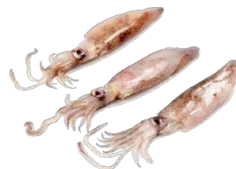
CALAMAR NACIONAL CONGELADO GRANEL