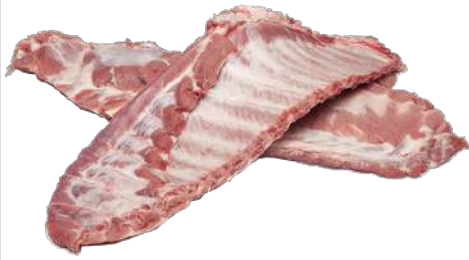
COSTILLEJAS CHATO MURCIANO