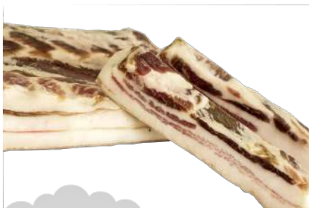
PANCETA FRESCA CHATO MURCIANO