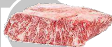
SECRETO DE ANGUS