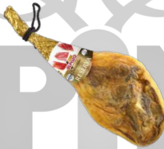
EL POZO SERIE ORO RESERVA