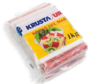
KRUSTA BOCAS DE MAR BOLSA 1 kg